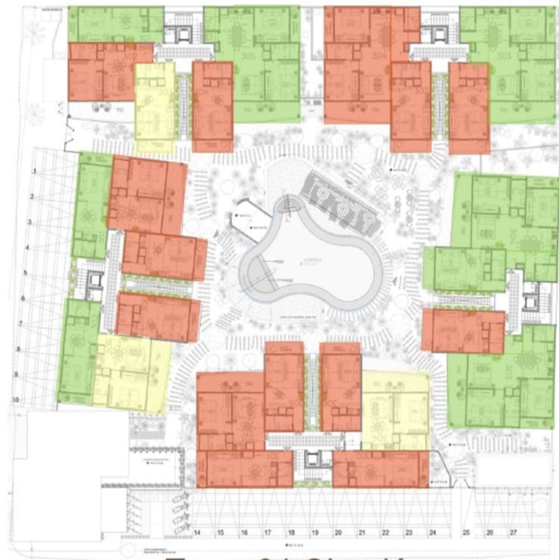
Torre 01 Sian Kaan